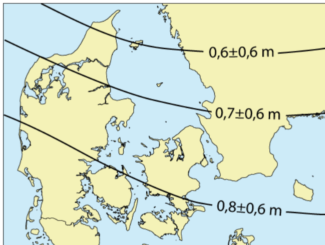
Figur 3. Samlet vurdering af havniveaustigninger i år 2100 i forhold til i dag.

Det dominerende bidrag til stigning i havspejlet omkring Danmark stammer fra den globale stigning. Havspejlet omkring Danmark forventes at stige med 0,8 \pm 0,6 m frem til år 2100. Omkring år 2200 vurderes det globale havspejl at være steget med 0,6–4 m. På kortere sigt – over de næste årtier – er der enighed om, at der kan ventes flere og kraftigere storme, som kan føre til hyppigere oversvømmelser af lavtliggende kystområder, som vi allerede oplever nu. På længere sigt – i et perspektiv på et århundrede eller mere – vil havspejlsstigningen og effekterne af ændrede vindforhold spille sammen og føre til øgede stormflodshøjder.