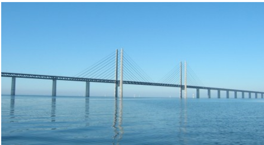
Klimaændringer i Danmark har betydning for mange sektorer i samfundet. Også byggeriet.

Temaet gennemgår nogle af de mest markante effekter af de igangværende og kommende klimaændringer med særlig fokus på Danmark og Rigsfællesskabet.