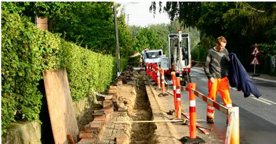
El-ledninger falder ned, men efter decemberorkanen i 1999 er kabellægning af el-distributionsnettet fremskyndet, og det forventes at være fuldt kabellagt inden for de næste ti år.