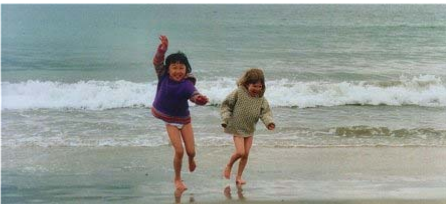
Det færøske klima er maritimt med små forskelle på temperaturen sommer og vinter og badning i sweater er helt almindelig.

Størst betydning for det færøske samfund ventes ændringerne i oceanet at få, fordi stigende temperaturer og ændrede strømforhold kan føre til ændrede fiskebestande omkring Færøerne.