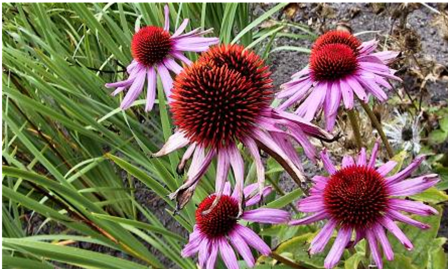
Med et ændret klima kommer nye træer og planter. Nogle arter bliver mere udbredt, mens andre går tilbage.

Danmark ligger for eksempel i dag i udkanten af området for udbredelsen af bynke-ambrosie ( Ambrosia artemisiifolia ), som er stærkt allergifremkaldende. Udenlandske undersøgelser viser, at den er i vækst, og hvis den breder sig til Danmark, kan den føre til flere pollenallergikere.