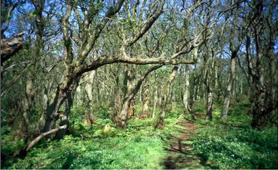
En mere naturnære skovdrift betyder, at skovene gradvis kommer til at rumme flere træarter.