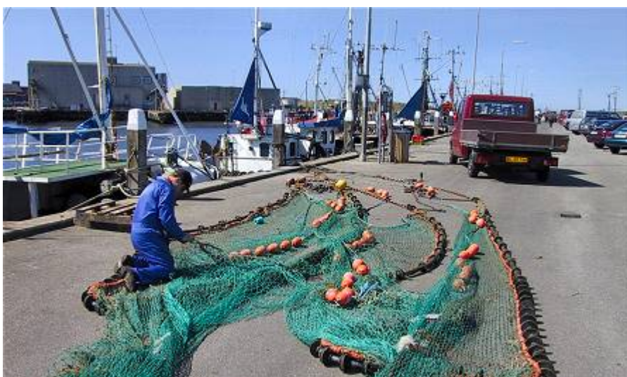
Klimaændringerne fører til ændringer i de marine økosystemer, herunder fiskearter, hvor nogle arter vil få fordele af ændringerne, mens andre vil gå tilbage.

Samtidig er fiskebestanden i danske farvande følsom over for udvaskning af næringsalte og risikoen for iltsvind i længerevarende perioder med stille og varmt vejr. Ligeledes kan ændrede nedbørmængder føre til ændringer i vandets saltholdighed, som igen har stor betydning for det marine miljø.