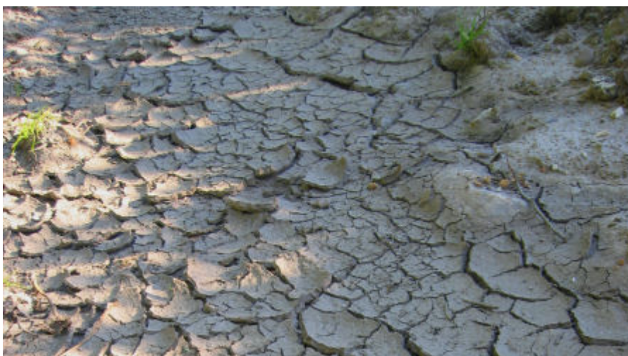
Mindre nedbør om sommeren kan føre til, at der kan indvindes mindre grundvand til forbrug og markvanding, hvis ikke vandføringen i vandløbene skal reduceres for meget.

Når temperaturen stiger, bliver vandet i vandløbene i jorden og i husene også varmere. Det betyder risiko for bakterievækst, hvis vandet bliver meget varmere og står for længe i rørene.