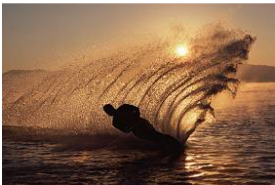
Et varmere klima med mindre nedbør om sommeren er der gode muligheder for udbygning af turismen i Danmark.

Det giver øget pres på danske strande, havne og sommerhusområder samt behov for udbygning af overnatningsfaciliteter i ferieområderne.