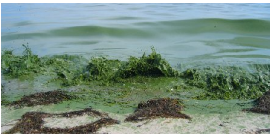
Højere temperatur sammen med en øget udvaskningen af kvælstof og fosfor kan give algerne optimale vækstbetingelser.

Mere nedbør om vinteren og mere intense nedbørsepisoder vil desuden øge udvaskningen af kvælstof, fosfor og pesticider til vandmiljøet.