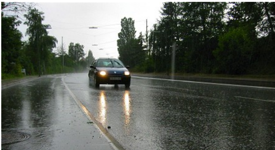
Det kan blive nødvendigt at lukke veje i lavtliggende områder som ådale i forbindelse med nedbøreprisoder.

Kraftigere nedbøreprisoder skaber også behov for at forbedre afvandingen af jernbaner for at undgå oversvømmelse og driftsforstyrrelser. Hertil kommer ekstra tilsyn og vedligeholdelse af baneskråninger.