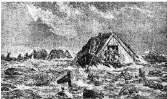
Den største stormflodskatastrofe i nyere tid skete den 12.-14. november 1872. Disse dage blev store dele af Lolland og Falster oversvømmet, 80 mennesker omkom og 50 skibe strandede på Sjællands østkyst. Grafik fra Illustreret Tidende 1872.