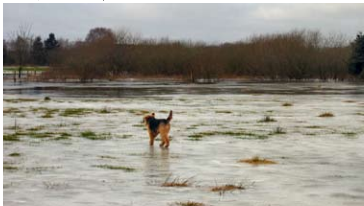
Figur 2 : Lavtliggende områder kan komme i problemer under kommende havniveaustigning. Her er det Kurt Winklers linse ud over en oversvømmet eng ved Mørke efter en storm.

De globale vandstandsstigninger kan dog vise sig at blive højere, da nye observationer antyder, at isen måske er mere sårbare.