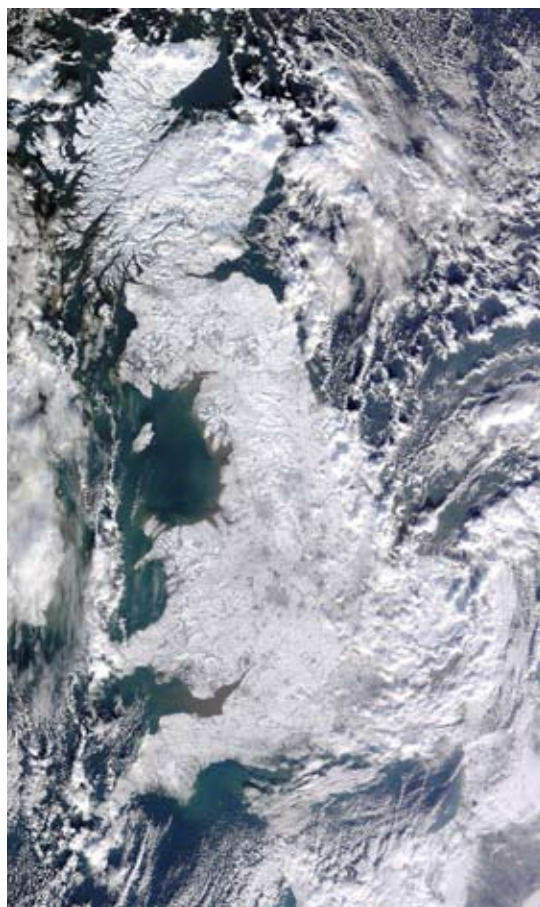
Figur 2. Den 7. januar 2010 var Storbritannien dækket af sne, som det ses på satellitbilledet fra den amerikanske Terra-satellit.

Global opvarmning... Jamen kan man i det hele taget se den nogle steder? Ja, en af verdens længste temperaturserier kaldes Central England Temperature (CET) series. Den indeholder temperaturdata helt tilbage fra 1659 både fordelt på sæsoner og på