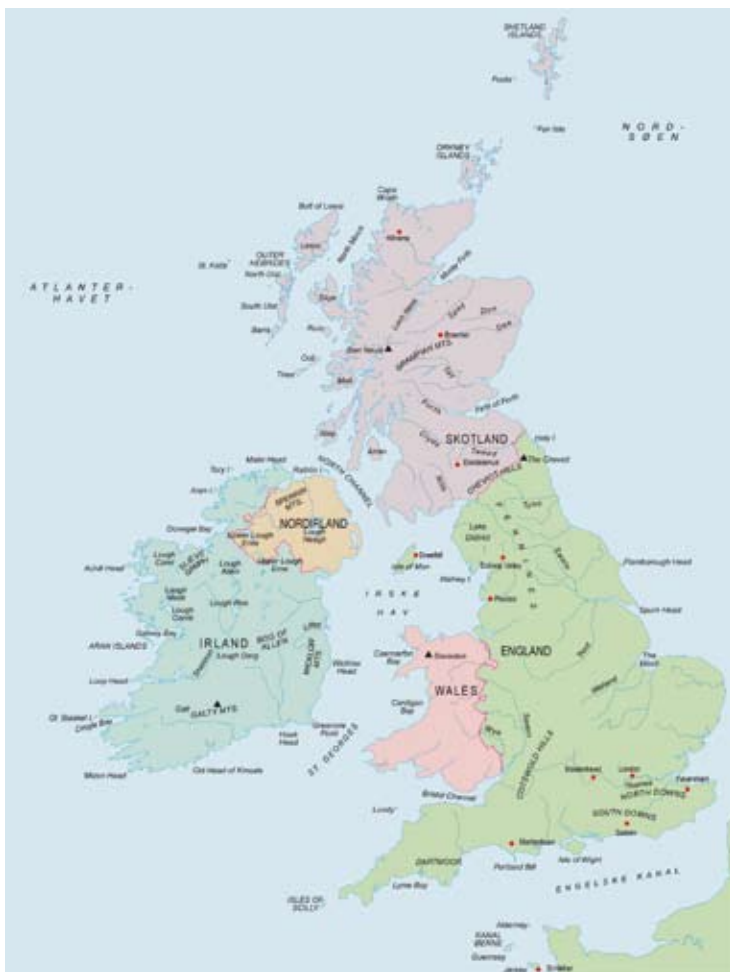
Figur 1. De lokaliteter, som er nævnt i teksten.